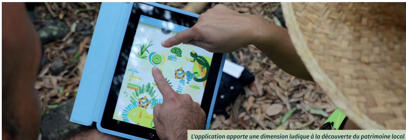
L'application apporte une dimension ludique à la découverte du patrimoine local

Deux balades numériques pour découvrir le territoire à partir d'une application téléchargeable sont en préparation pour cet été. Une autre façon de (re)découvrir son environnement.