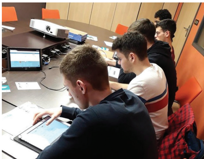
Atelier "découverte de l'emploi store" lors du forum des jobs d'été en Février

La situation n'est pas spécifique au Pays de Meslay-Grez. De nombreuses entreprises mayennaises, et plus généralement ligériennes, éprouvent des difficultés pour recruter leur personnel et cela constitue un frein à leur développement. Face à cette situation, l'État, la Région et les partenaires sociaux ont engagé une Stratégie Régionale Emploi, Formation, Orientation Professionnelles (SREFOP) avec l'ambition d'agir de manière concrète et coordonnée, en activant tous les leviers, y compris les plus innovants, sur les besoins en compétences des entreprises.