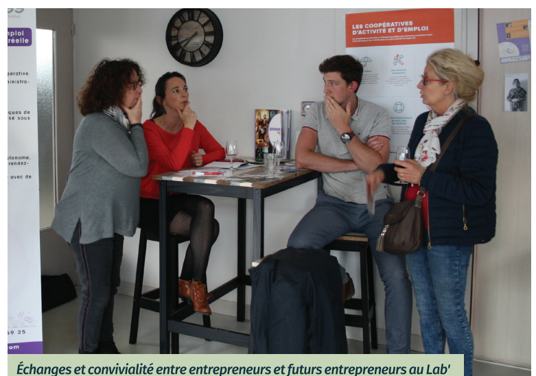
Échanges et convivialité entre entrepreneurs et futurs entrepreneurs au Lab'

Ce tarif comprend l'accès à l'espace d'accueil, aux bureaux,