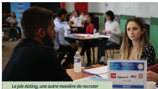
Le job dating, une autre manière de recruter

Fort de cette dynamique de territoire, ne doutons pas que les résultats seront à la hauteur des enjeux. ■